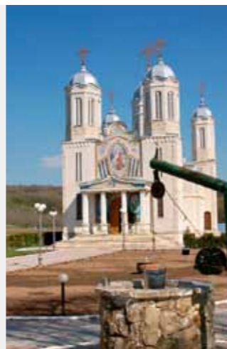
Kirche des Klosters St. Andreas