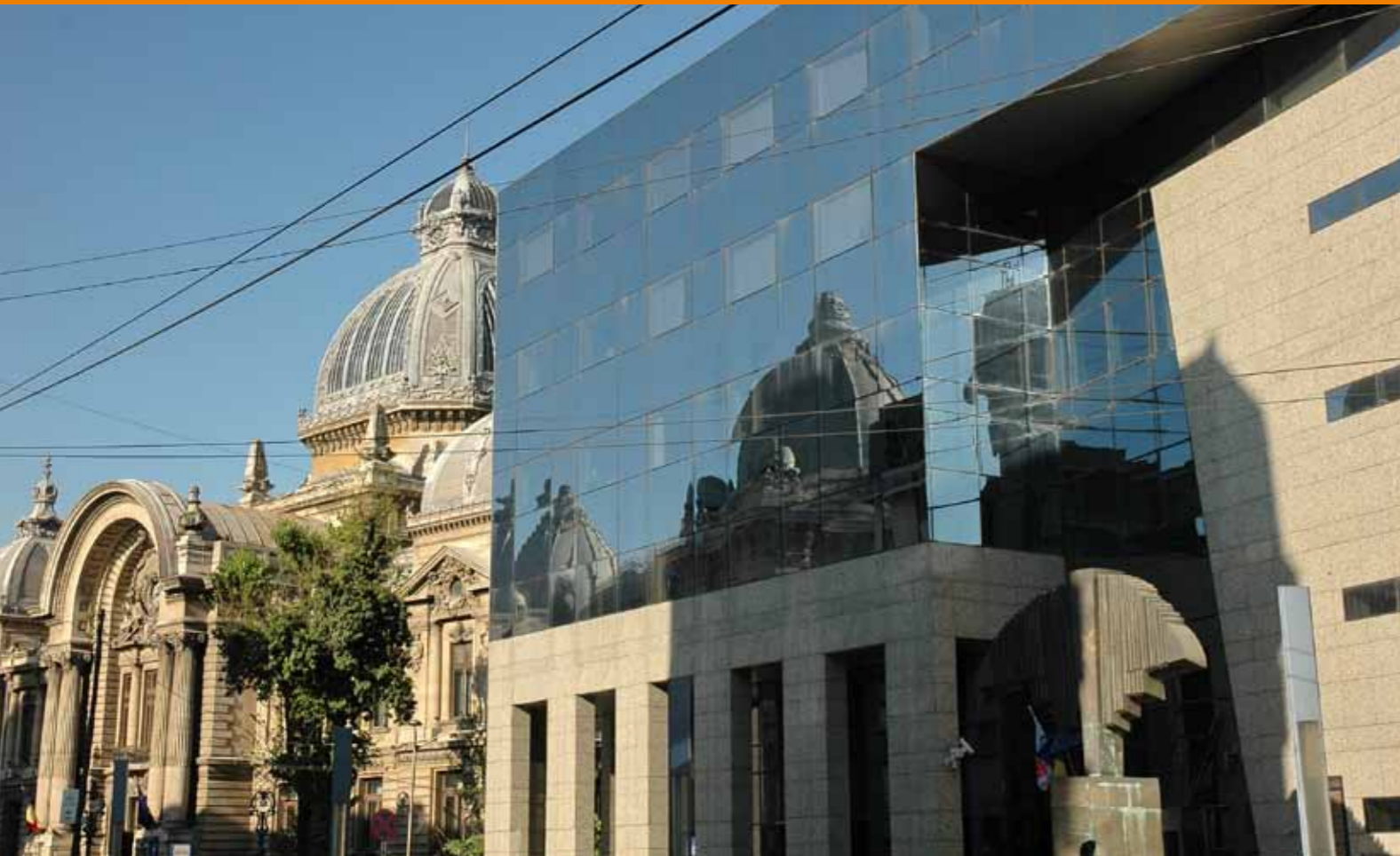
Altes und modernes Bukarest

Ein weiteres Erlebnis war die Einkehr in den Klöstern Dervent, Saon und Cocosi und die Fahrt nach Histria zu den Überresten einer alten griechischen Siedlung aus dem 7. Jahrhundert. Auch die Begegnung mit dem Imam in der türkischen Moschee in Babadag aus dem 14. Jahrhundert brachte Erkenntnisse im interreligiösen Dialog. Weitere beeindruckende Programmpunkte waren die Fahrt von Tulcea aus mit dem Schiff ins