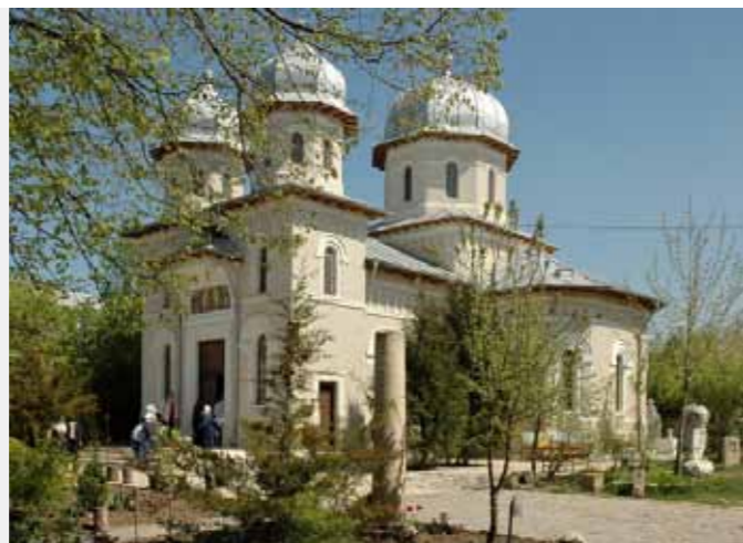
Klosterkirche in Dervent