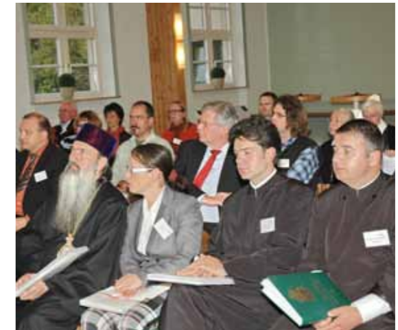
Theorie und praktische Übungen wurden eng miteinander verbunden