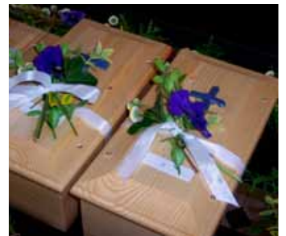
Speziell angefertigte Särge aus der Werkstatt für Menschen mit Behinderung

das nach seiner Geburt verstirbt oder auch ein Erwachsener findet es seine letzte Ruhe. In Zusammenarbeit mit einer der Werkstätten der Diakonie Neuendettelsau haben wir Fötensärgchen entwickelt. Schüler der Werkstätte fertigen sie aus Fichte, dem sogenannten Mutterholz, an. Ein blau glasiertes Tonkreuz, das unfertig wirkt, deutet daraufhin, dass auch das verstorbene Kind noch unvollkommen war aber bei seinem Vater im Himmel geborgen sein wird. All das zusammen bedeutet für die Eltern, dass die Kinder noch so klein waren und nur von wenigen Menschen bisher „gekannt“ waren, obwohl sie noch einen unverlierbaren Stellenwert bekommen. Wir geben menschliches Leben, das aus Gottes Hand geschenkt wurde, wieder in seine Hand zurück, dass er es vollendet. „Deine Augen sahen mich als ich noch nicht bereit war“, so steht es in Psalm 139. Von Anfang an war ihm dieses Leben wichtig, von Anfang ist Gott an seiner Seite. Diese Gewissheit möchten wir an die Eltern und an alle, die mit ihnen traurig sind weitergeben. „Und alle Tage waren in dein Buch geschrieben, die noch werden sollten und von denen keiner da war.“ Auch diese Kinder sind nicht vergessen, in den Herzen der Eltern und bei Gott, weil Er keinen übersieht.