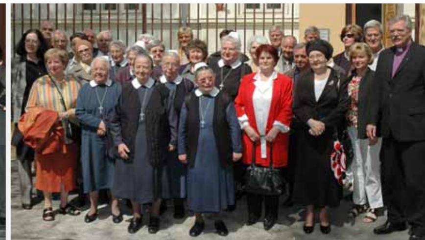
Reisegruppe aus Neundettelsau nach einem gemeinsamen Gottesdienst mit Gemeindegliedern der Evangelisch-Lutherischen Gemeinde in Konstanz