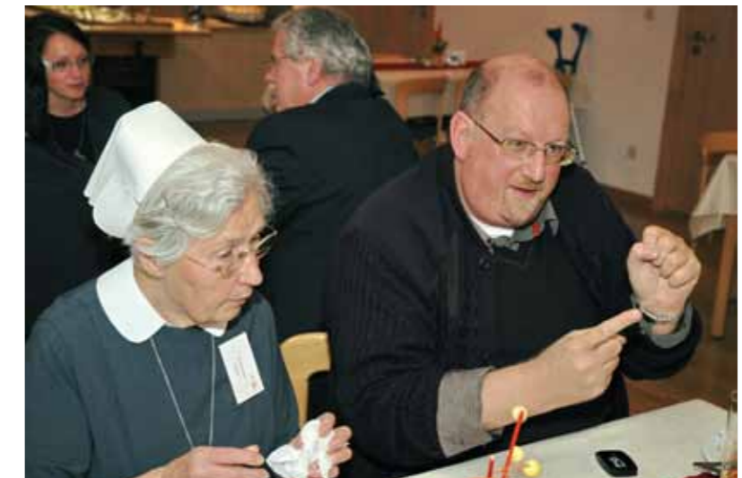
Während der Tagungspausen fand ein fachlicher Austausch statt