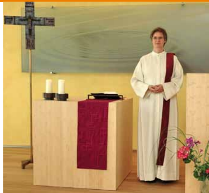
Die abgebildete Liturgische Kleidung kann von Neuendettelsauer Diakoninnen und Diakonen mit Prädikantenbeauftragung in den Einrichtungen der Diakonie Neuendettelsau getragen werden.

Die liturgische Kleidung macht auch eine Unterscheidung zu dem Alltäglichen deutlich. In Krankenhausgottesdiensten ist es andererseits auch den Patientinnen und Patienten oft ein Bedürfnis, nicht im Morgenmantel oder Jogginganzug am Gottesdienst teilzunehmen, sondern richtige Kleidung anzuziehen. So haben beide Seiten, Gemeinde, in dem Fall eben die Krankenhause-