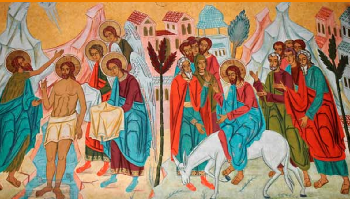
Taufe Jesu und Einzug in Jerusalem, Kloster- kirche Dervent