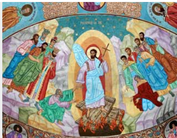
Fresco. Anastasis, Orthodoxe Dumitru-Kirche, Babadag