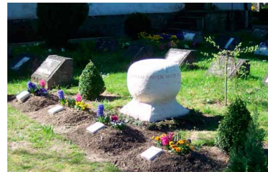
Gräberfeld auf dem Friedhof der Diakonie Neuendettelsau