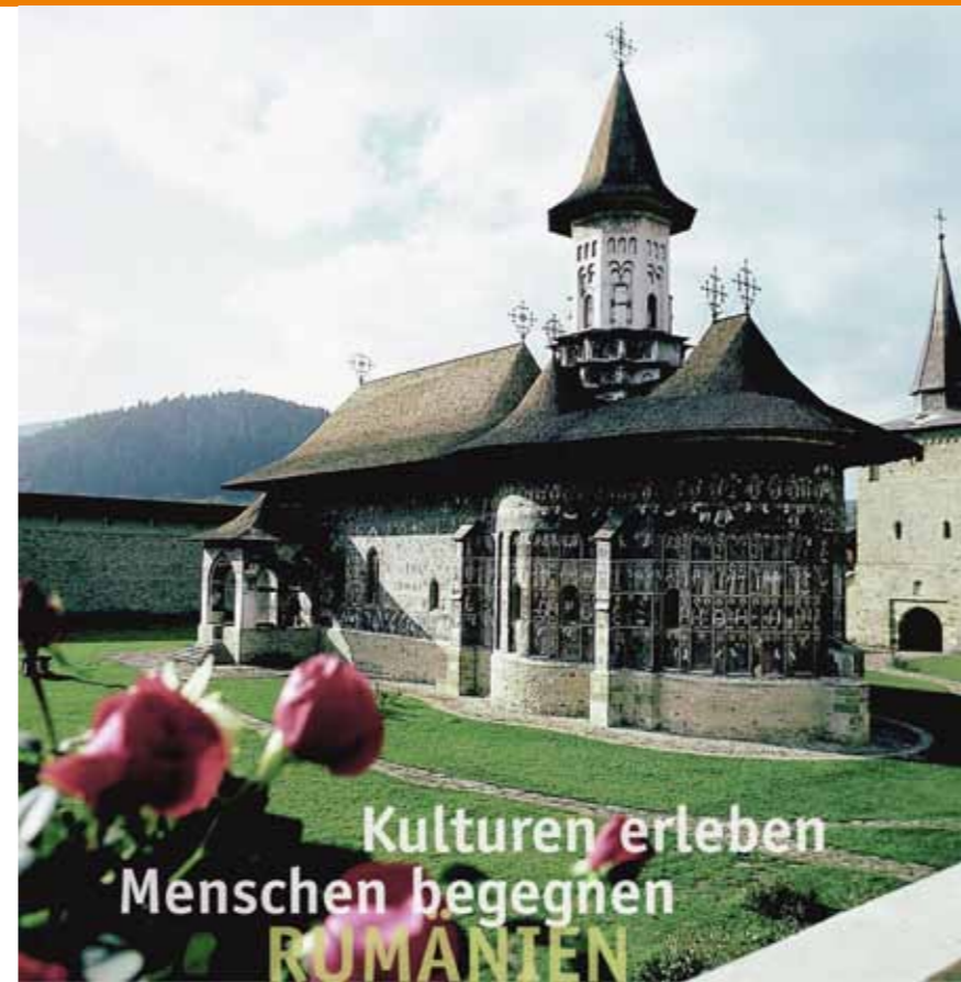
Die Kirche von Sucevita

Diakonische Schwestern- und Bruderschaft