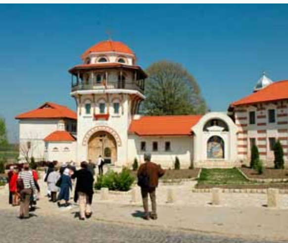
Eingang zum Kloster Dervent