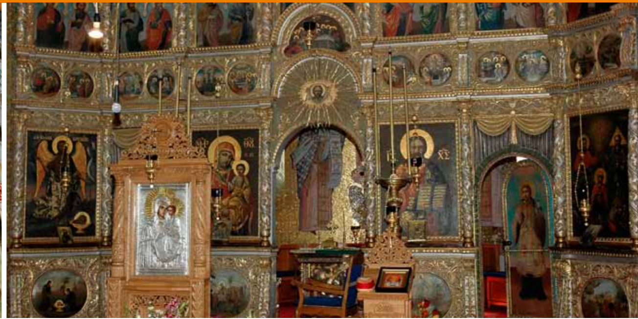
Ikonostase in der Kirche des Klosters Cocosi