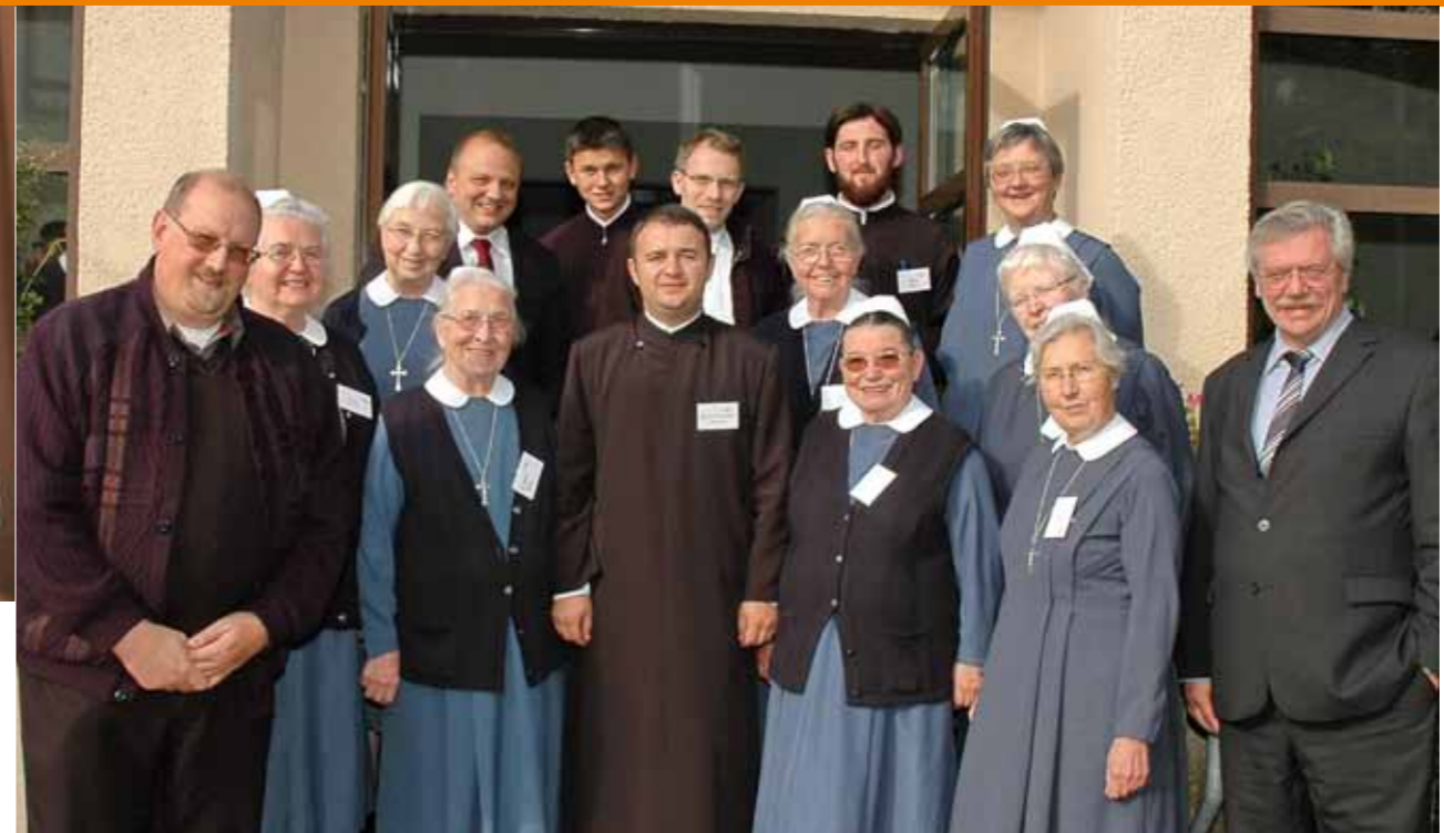
Unter den Teilnehmern der Tagung befanden sich neben Neuendettelsauer Diakonissen u. a. auch Geistliche aus der Rumänischen Orthodoxen Kirche