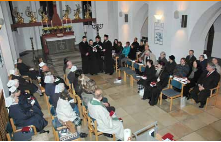
Während der Tagzeitengottesdienste gaben die rumänischen Teilnehmer einen Einblick in den Psalmengesang der Rumänischen Orthodoxen Kirche