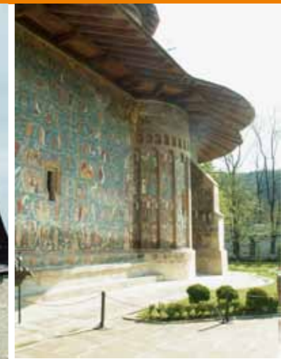
Kirche im Kloster Voronet mit seinen Fresken